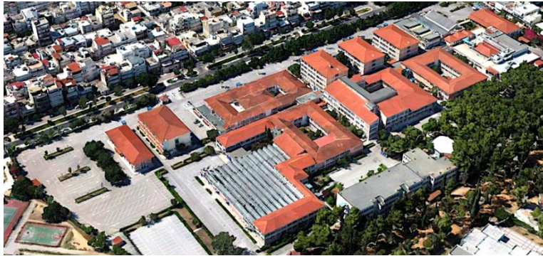
Εικόνα 1: Οι εγκαταστάσεις του εκτείνονται στα κτήρια Κ6, Κ7 του ΠΑΔΑ και Σχεδιάγραμμα Πανεπιστημιούπολης Άλσους Αιγάλεω και αρίθμηση κτηρίων